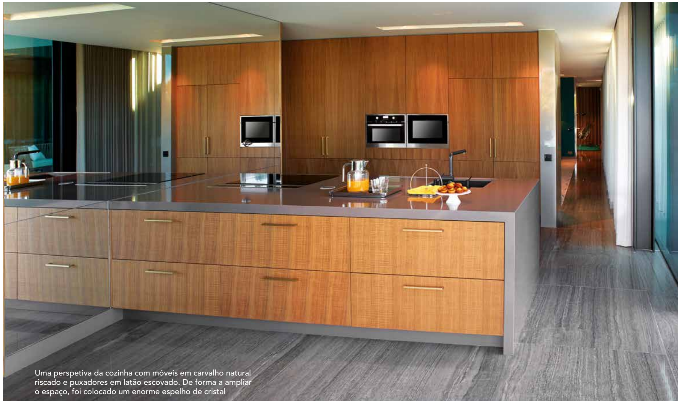
Uma perspetiva da cozinha com móveis em carvalho natural riscado e puxadores em latão escovado. De forma a ampliar o espaço, foi colocado um enorme espelho de cristal