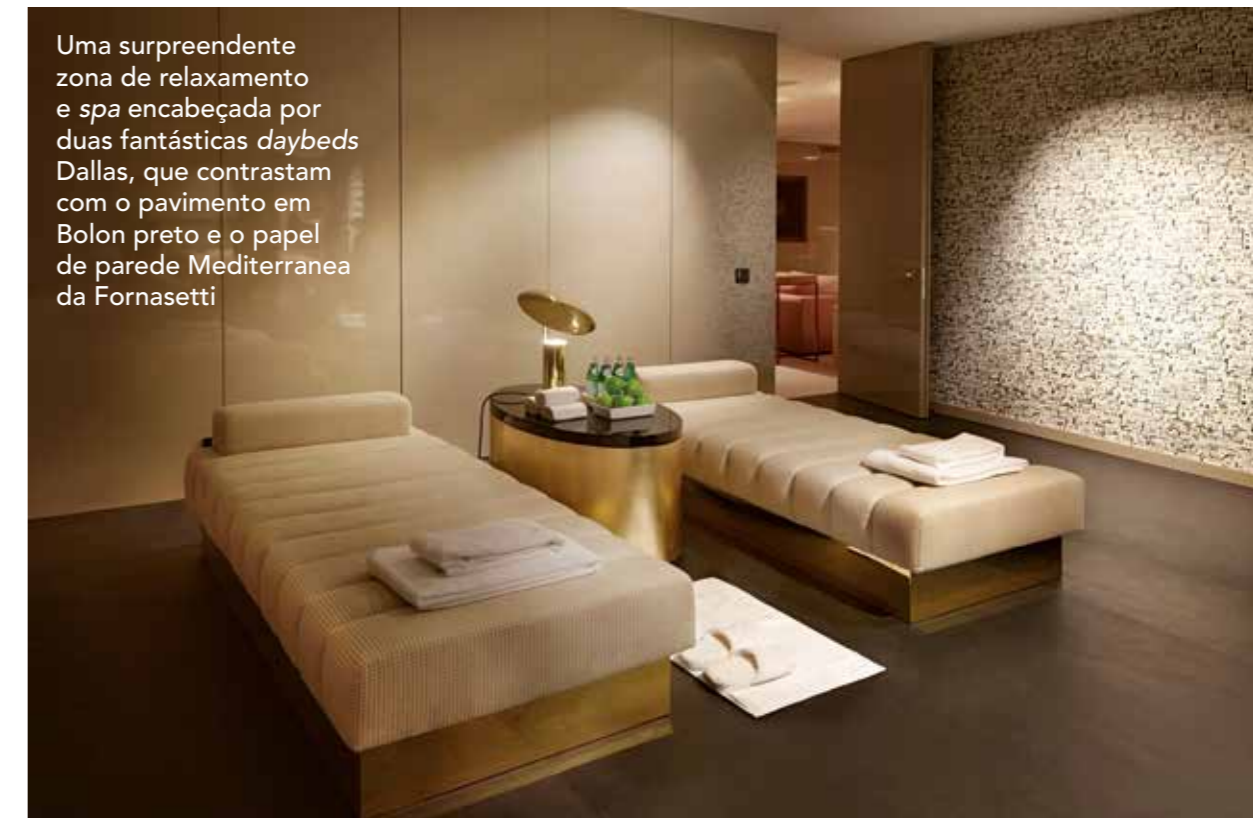
Uma surpreendente zona de relaxamento e spa encabeçada por duas fantásticas daybeds Dallas, que contrastam com o pavimento em Bolon preto e o papel de parede Mediterranea da Fornasetti