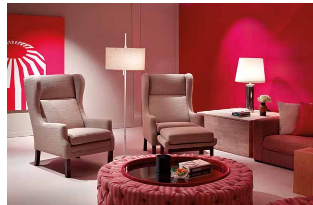
Ao lado, a sala multimédia em tons de cinza e encarnado com paredes revestidas a linho encerado. Aqui, o destaque vai para a mesa de centro Frankie em capitonê, num espaço que se pretende descontraído e informal

com vinoteca, três suites familiares e duas suites para hóspedes, todas elas equipadas com quartos de banho próprios. Existe, ainda, um ginásio, um spa e, por fim, a garagem. Em relação à decoração propriamente dita, a Ding Dong recorreu a diferentes marcas internacionais, artistas contemporâneos e peças da autoria