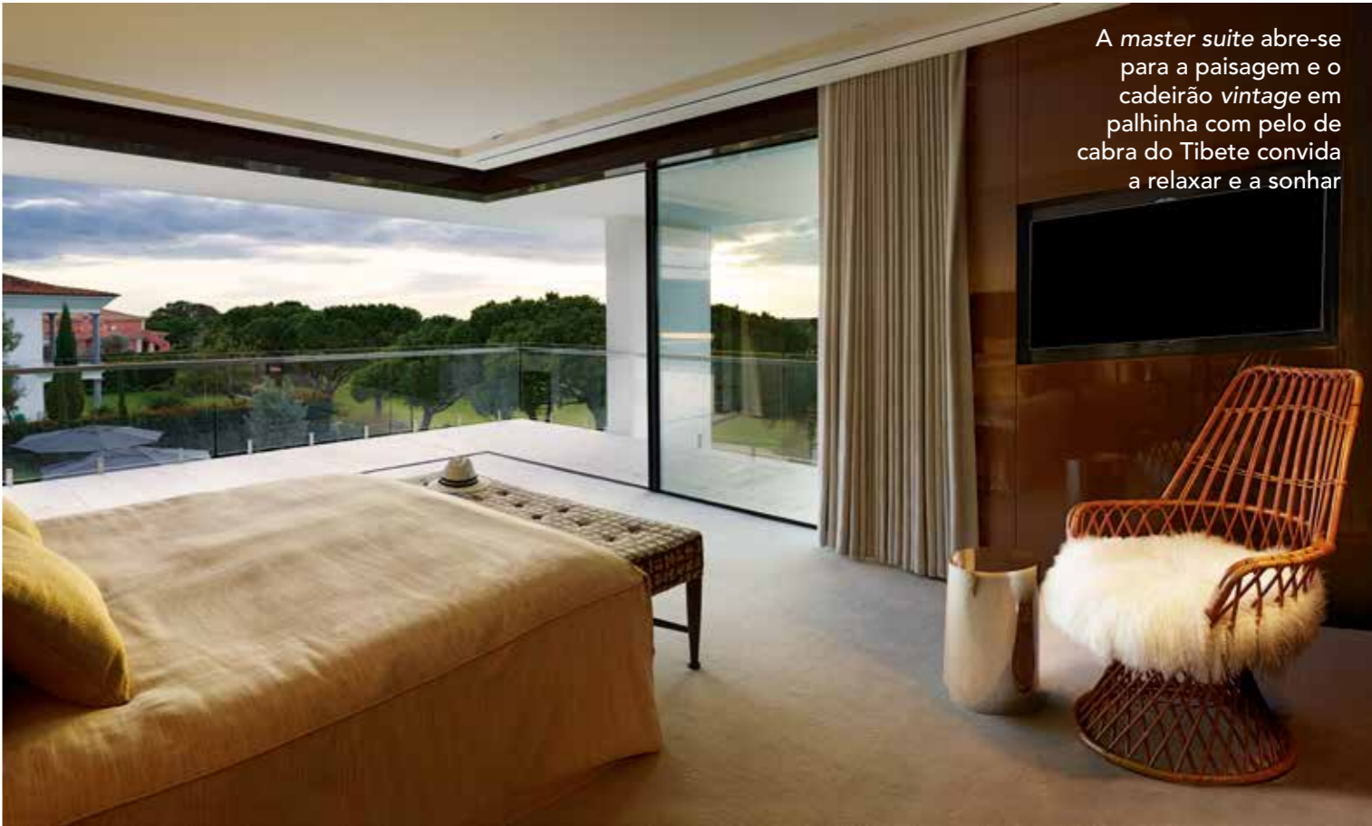
A master suite abre-se para a paisagem e o cadeirão vintage em palhinha com pelo de cabra do Tibete convida a relaxar e a sonhar