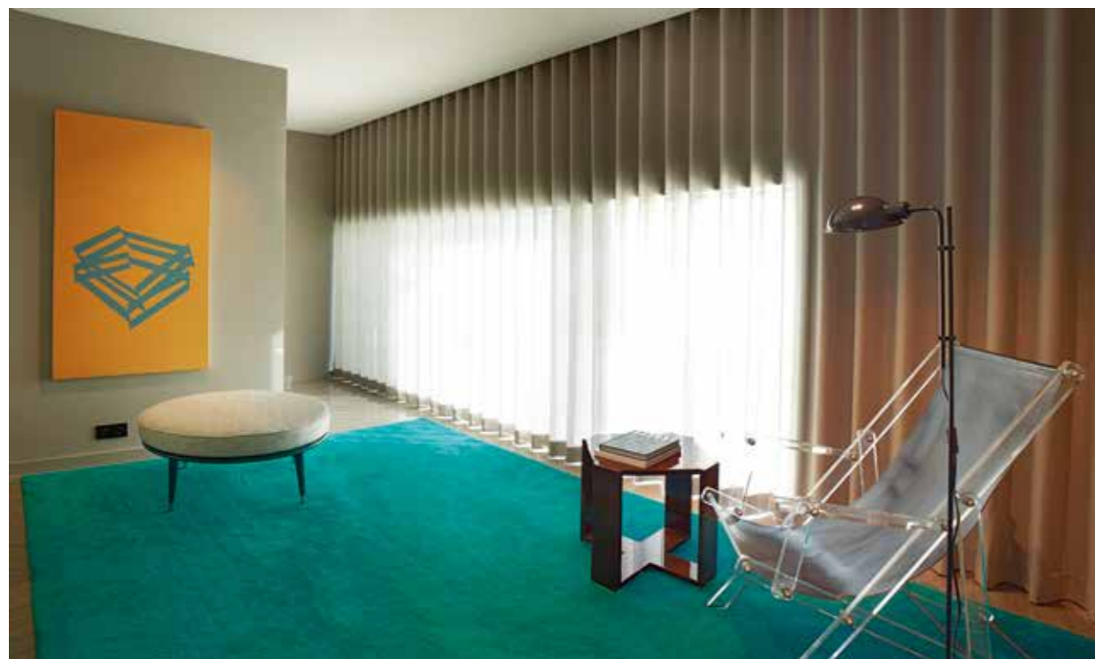
À esquerda, a antecâmara da casa de banho social, onde, junto à cadeira de acrílico, se pode ver uma elegante mesa de apoio Bond em raiz de nogueira. Na parede, é impossível ficar indiferente à obra de Ricardo Pistola