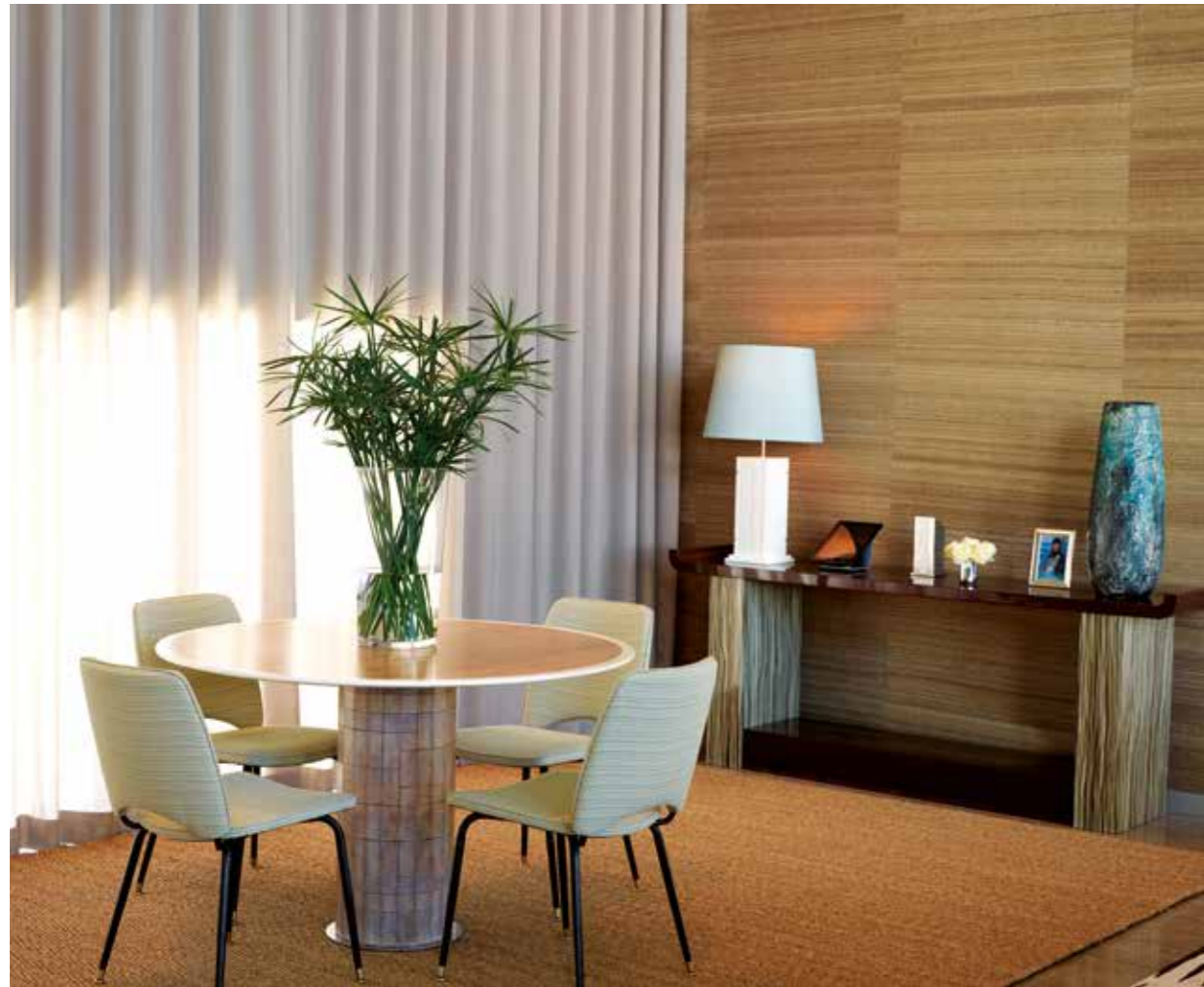
À direita, podemos notar que o motivo do tapete do hall se repete na sala de estar, cujos tons predominantes estão também presentes no par de cadeirões vintage . Sobre a consola em ébano de Macassar encontra-se um apontamento floral numa jarra da Lalique e na parede um espelho Sphere da Ding Dong. Em cima, a zona de jogos com uma mesa Woody em carvalho lixiviado e laca branca e cadeiras com estofa Kravet