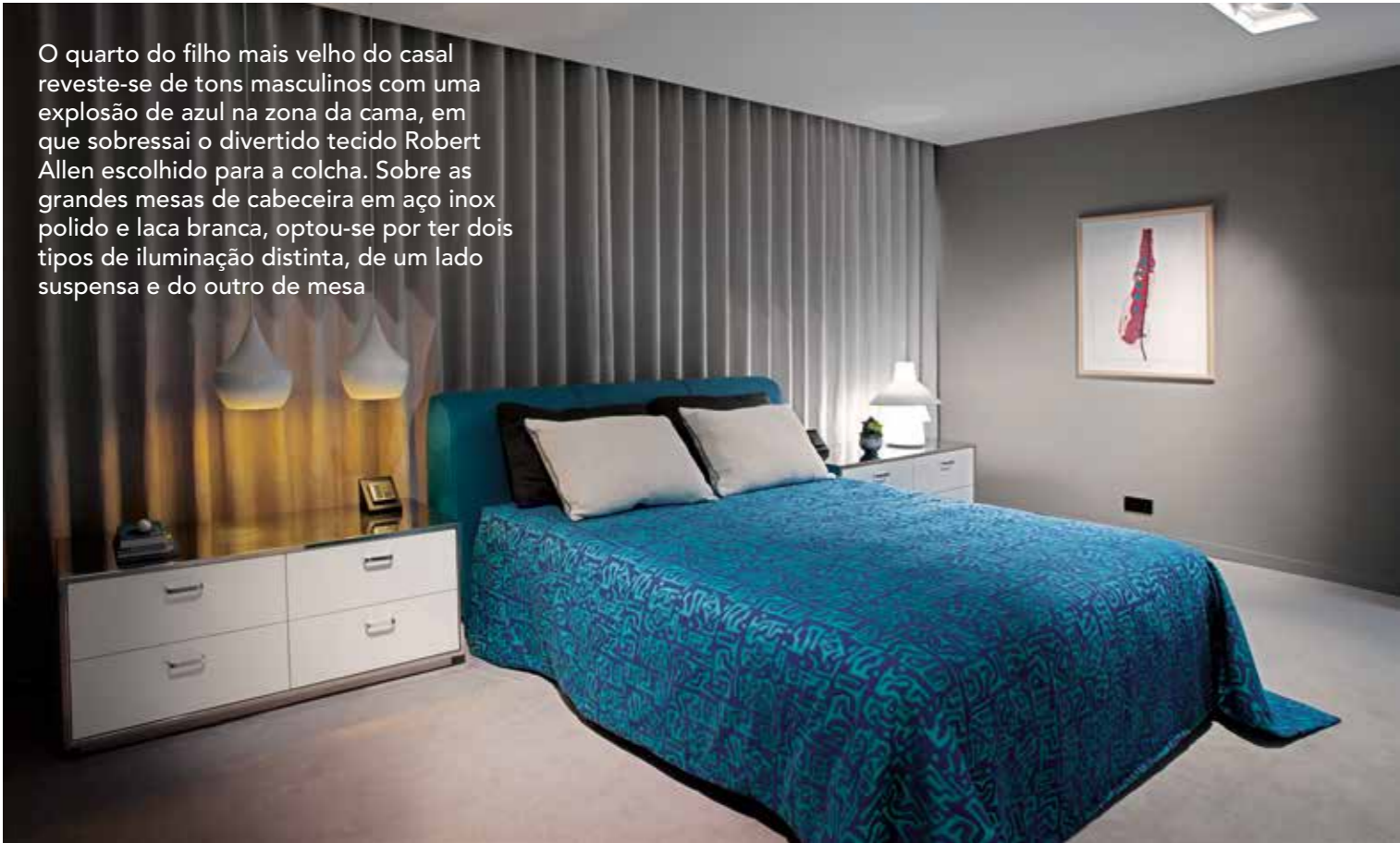
O quarto do filho mais velho do casal reveste-se de tons masculinos com uma explosão de azul na zona da cama, em que sobressai o divertido tecido Robert Allen escolhido para a colcha. Sobre as grandes mesas de cabeceira em aço inox polido e laca branca, optou-se por ter dois tipos de iluminação distinta, de um lado suspensa e do outro de mesa