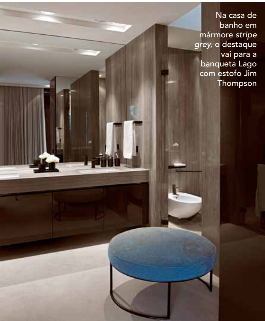
Na casa de banho em mármore stripe grey , o destaque vai para a banqueta Lago com estofado Jim Thompson